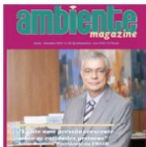
Setembro 2014 | nº 66 (1821 downloads)