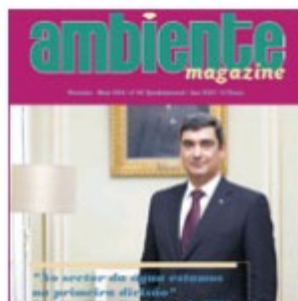
Maio 2014 | nº 65 (1831 downloads)