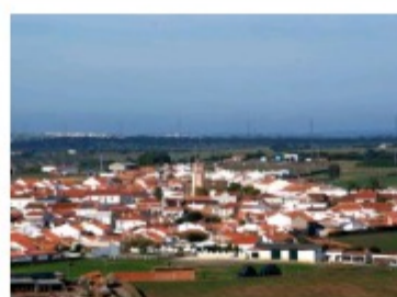
NOVA ETAR DA AMARELEJA CUSTA 414 MIL EUROS