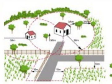
LOULÉ PROMOVE INFORMAÇÃO PÚBLICA SOBRE DEFESA DA FLORESTA CONTRA INCÊNDIOS