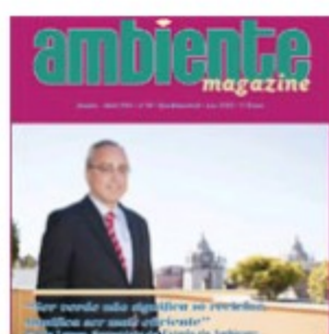
Janeiro 2015 | nº 68 (1983 downloads)