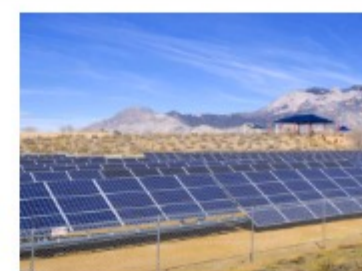
NEOEN LANÇA MAIOR INSTALAÇÃO FOTOVOLTAICA DA EUROPA