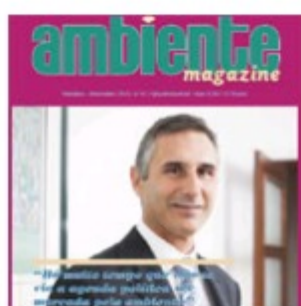
Dezembro 2014 | nº 67 (1867 downloads)