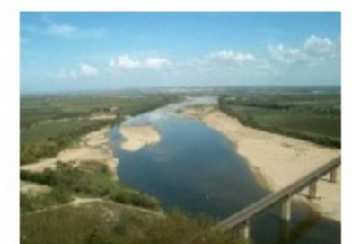
CELTEJO DIZ CUMPRIR LIMITES DE DESCARGA E DESTACA CERTIFICAÇÃO