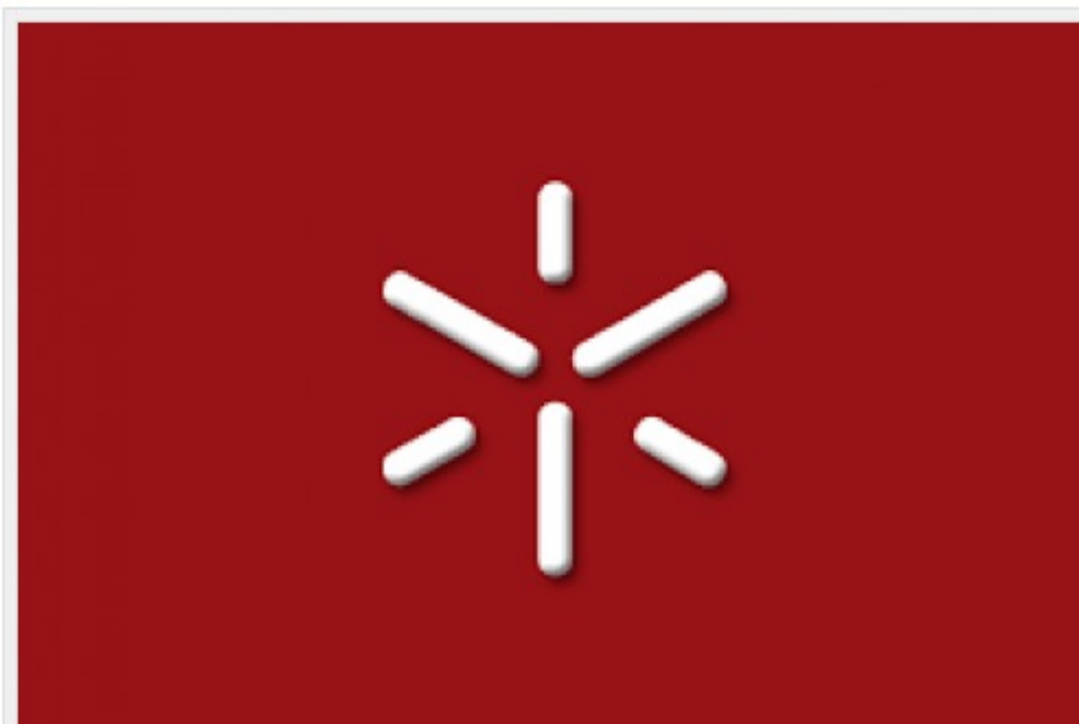
Parceria do Centro para a Valorização de Resíduos da UMinho

O projeto, intitulado “Valorização de Resíduos Orgânicos: Produção de Substâncias Húmicas”, foi recentemente aprovado no âmbito do programa de cooperação Interreg V-A Espanha-Portugal. Conta com a parceria do Centro para a Valorização de Resíduos da UMinho, da Lipor - Serviço Intermunicipalizado de Gestão de Resíduos do Grande Porto, da Braval - Valorização e Tratamento de Resíduos Sólidos e, do lado espanhol, da Sociedade Galega do Meio Ambiente, da Universidade de Santiago de Compostela e do Centro de Valorización Ambiental del Norte. O site oficial é www.res2valhum.org .