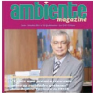
Setembro 2014 | nº 66 (2286 downloads)