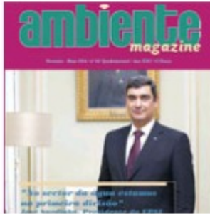
Mai 2014 | nº 65 (2334 downloads)