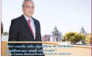
Janeiro 2015 | nº 68 (2544 downloads)