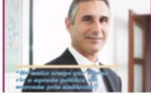
Dezembro 2014 | nº 67 (2329 downloads)