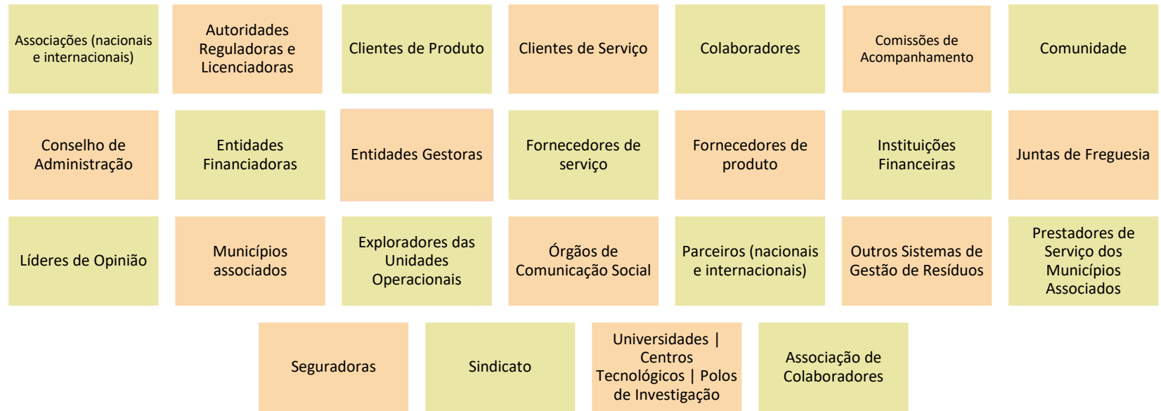
INFLUÊNCIA DA PARTE INTERESSADA NA ORGANIZAÇÃO (OU PROJETO OU LINHA DE NEGÓCIO)