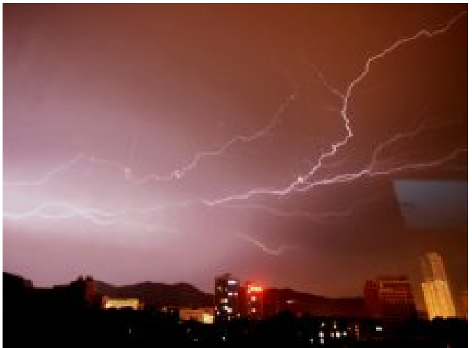
NASA CONCLUI QUE TROVOADAS CAUSARAM GRANDES INCÊNDIOS NO ALASCA E CANADÁ