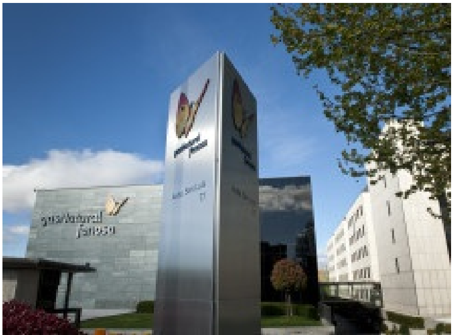
GAS NATURAL FENOSA DISTINGUIDA PELA ANUÁRIO DE SUSTENTABILIDADE 2017