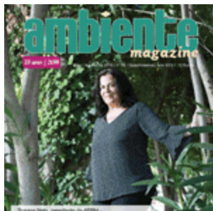
Maio 018 | nº78 (540 descarregamentos)