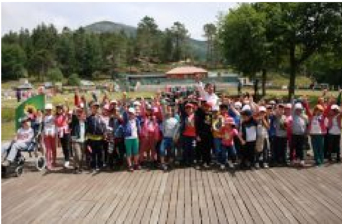
2000 ALUNOS DE ARCOS DE VALDEVEZ VÃO ABRAÇAR A FLORESTA