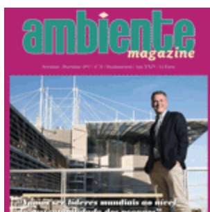
Setembro 017 | nº76 (467 descarregamentos)