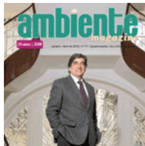
Janeiro 018 | nº77 (496 descarregamentos)