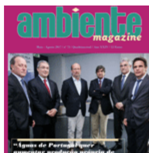
Agosto 017 | nº75 (1684 descarregamentos)