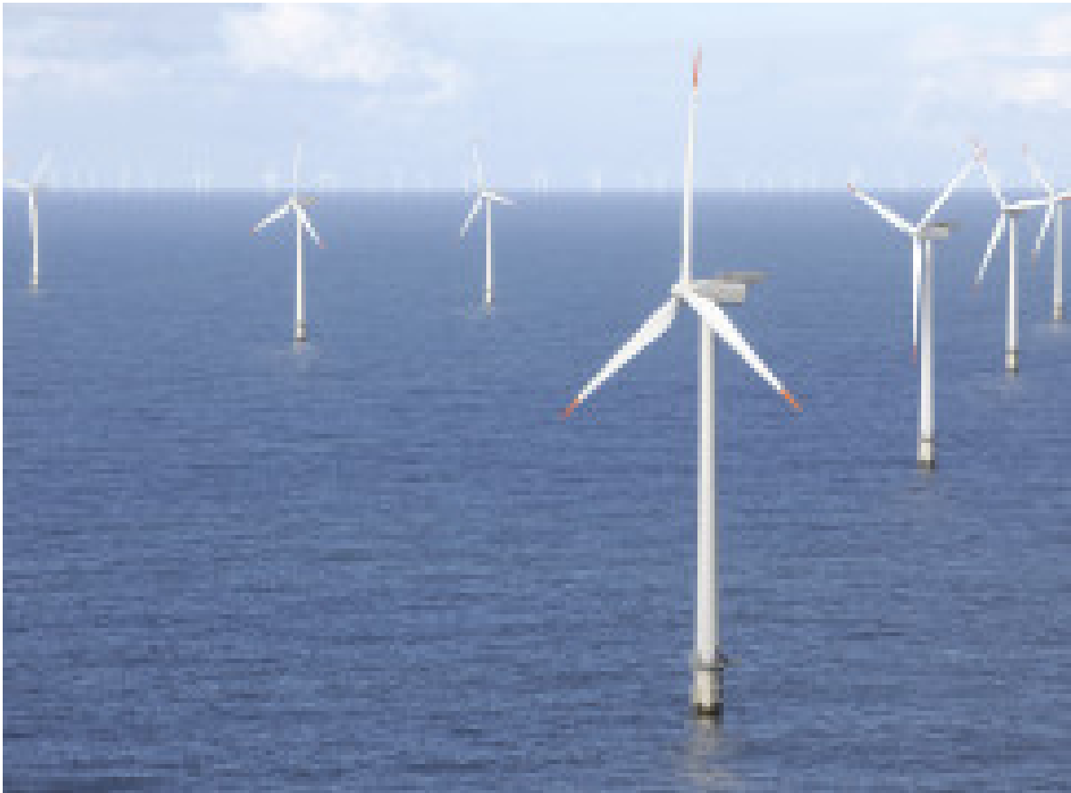
ABB VAI CONECTAR MAIOR PARQUE EÓLICO OFFSHORE DO MUNDO À REDE ELÉTRICA DO REINO UNIDO

PARLAMENTO APROVA BENEFÍCIOS FISCAIS ÀS ENTIDADES DE GESTÃO FLORESTAL